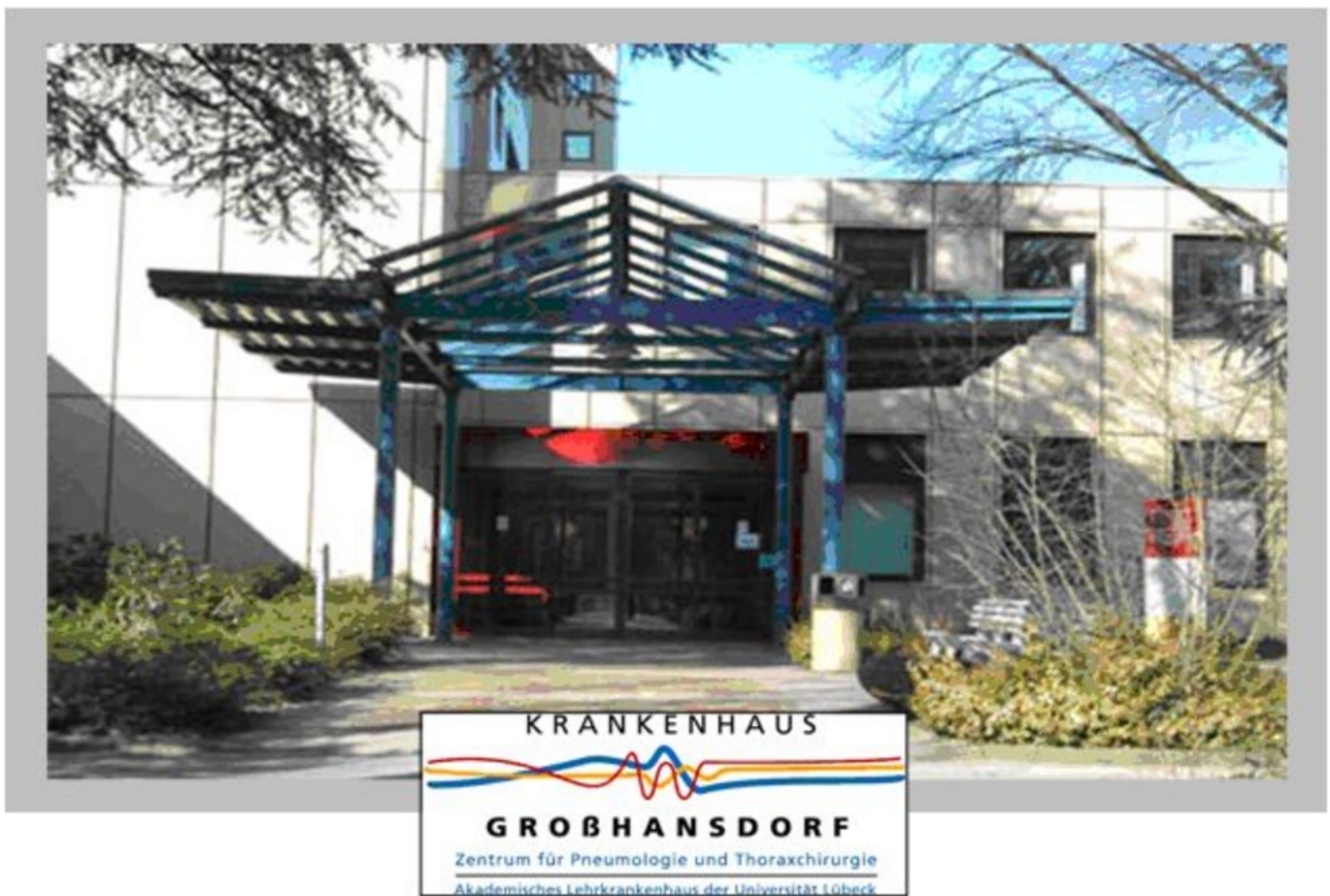
Abbildung: Krankenhaus Großhansdorf