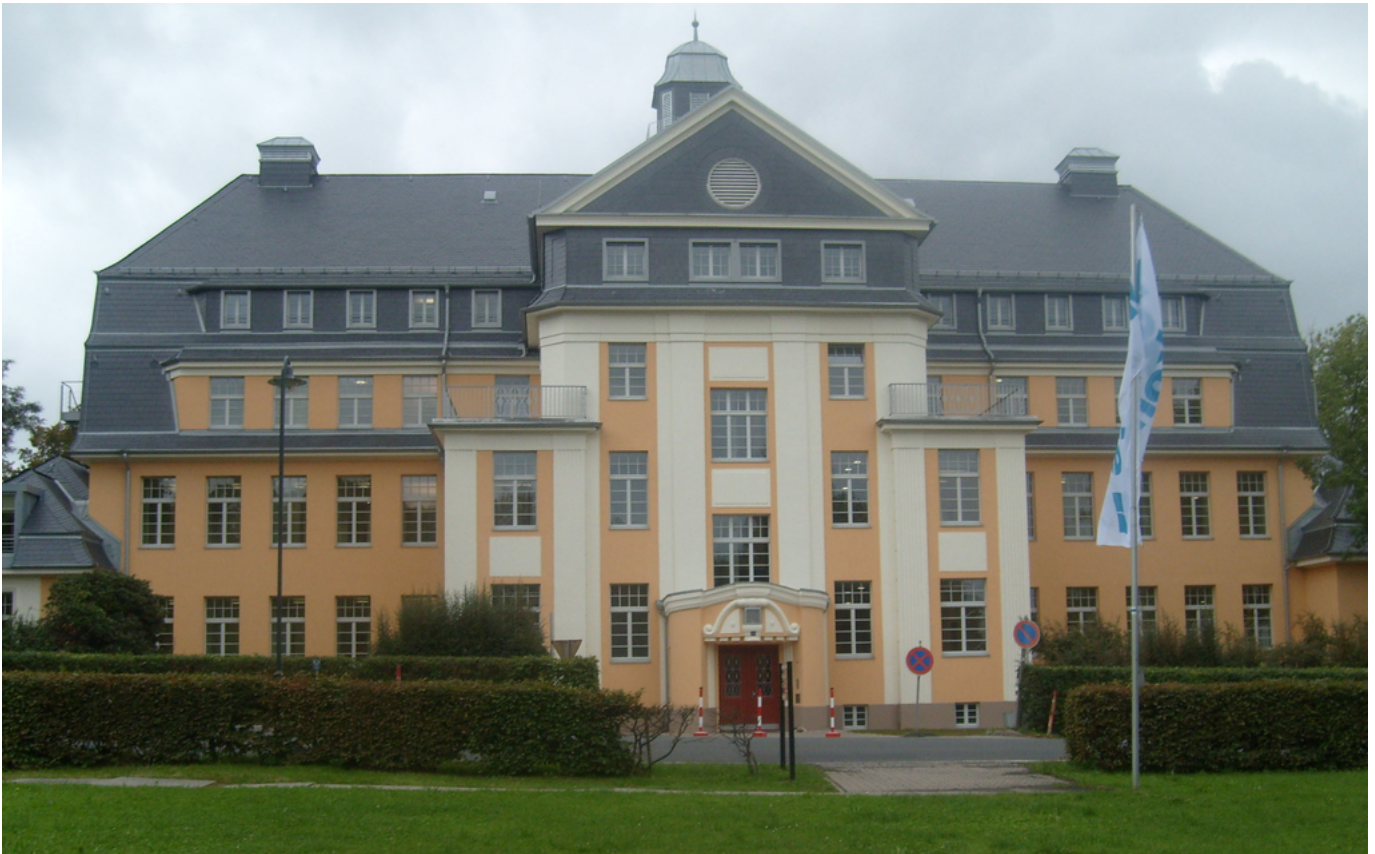
Abbildung: Haus 20 b

Das Fachkrankenhaus für Psychiatrie, Psychotherapie, Neurologie und Neurophysiologie in der Trägerschaft der Diakoniewerk Zschadraß gGmbH ist eine Fachklinik für psychiatrische und neurologische Behandlungen am traditionsreichen Standort in Zschadraß. Von hier aus versorgt es ein Einzugsgebiet von ca. 280 000 Einwohnern in Teilen der Landkreise Leipziger Land und Mittelsachsen. Die Klinik für Psychiatrie und Psychotherapie bietet 115 Planbetten für den stationären Bereich und 45 Plätze für den teilstationären Bereich der Tageskliniken an den Standorten in Borna, Grimma und Rochlitz. Des weiteren übernimmt die psychiatrische Fachklinik im Rahmen der Psychiatrischen Institutsambulanz (PIA) auch ambulante Leistungen.