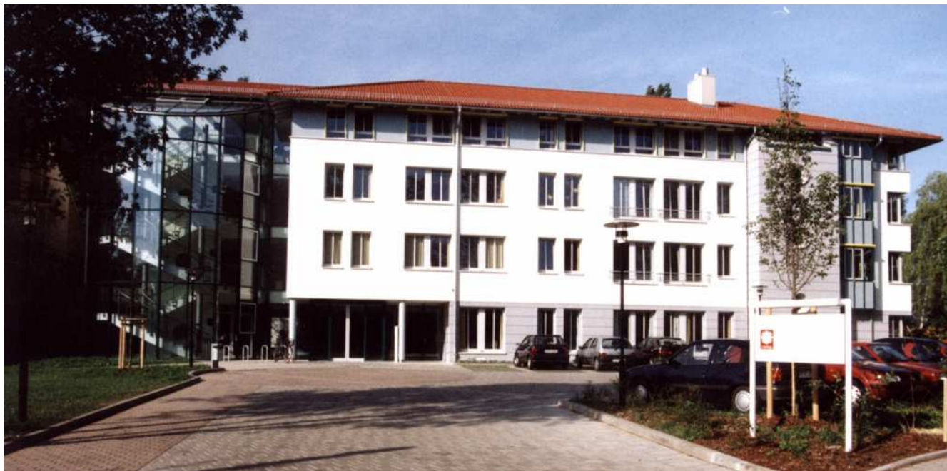
Abbildung: St.-Marien-Krankenhaus Dresden

Sehr geehrte Leserin, sehr geehrter Leser,