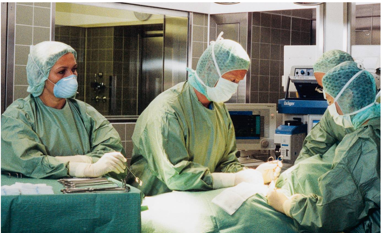
Abbildung: Krankenhaus Martha-Maria München, OP