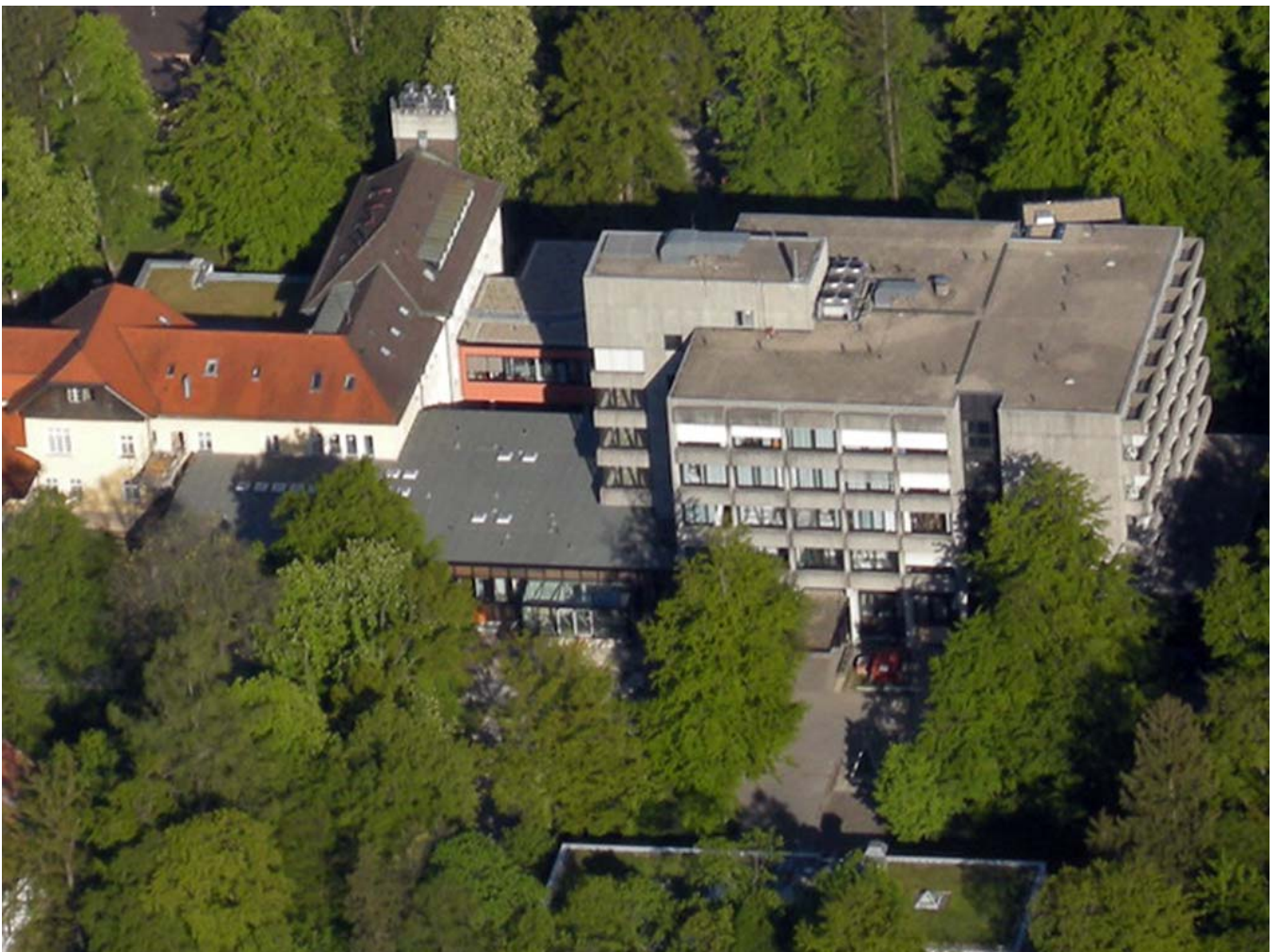
Abbildung: Krankenhaus Martha-Maria München, Luftaufnahme

Dieser Qualitätsbericht wurde mit dem von der DKTIG herausgegebenen Erfassungstool IPQ auf der Basis der Software ProMaTo® QB im August 2009 erstellt.