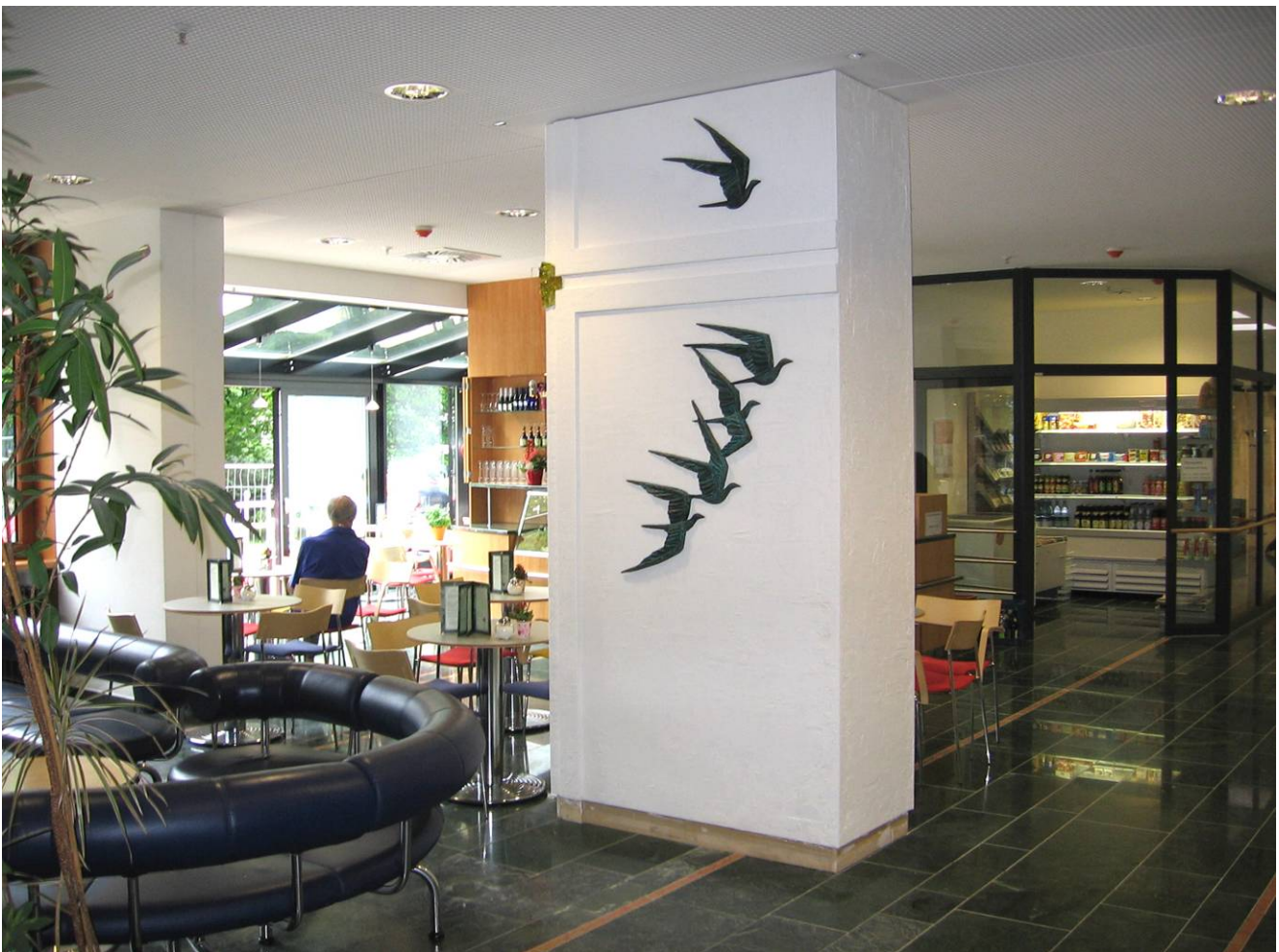
Abbildung: Krankenhaus Martha-Maria München, Eingangsbereich

Im März 2009 feierte das Krankenhaus Martha-Maria München den Abschluss mehrjähriger Erweiterungs- und Sanierungsarbeiten. Seit Ende 2005 wurden der Bettentrakt erneuert, der Operationstrakt ausgebaut, ein Neubau für die Intensivstation und Funktionsräume errichtet, aus Brandschutzgründen ein neues Treppenhaus angebaut und im Eingangsbereich eine Cafeteria eingerichtet.