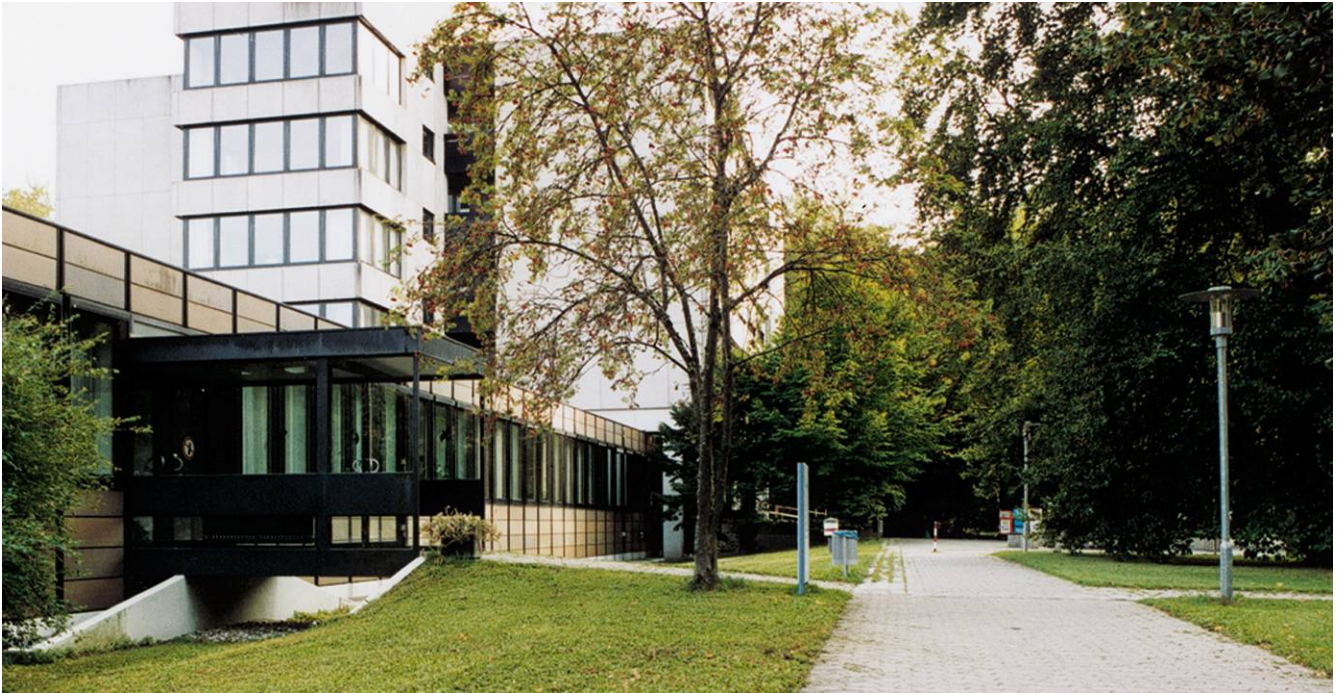
Abbildung: Krankenhaus Martha-Maria München, Außenbereich

Das Krankenhaus Martha-Maria München ist eine Einrichtung im Diakoniewerk Martha-Maria und Lehrkrankenhaus der Ludwig-Maximilians-Universität München. Eine ruhige Stadtrandlage und ein weitläufiges grünes Gelände sind die äußeren Bedingungen für die Genesung der Patientinnen und Patienten.