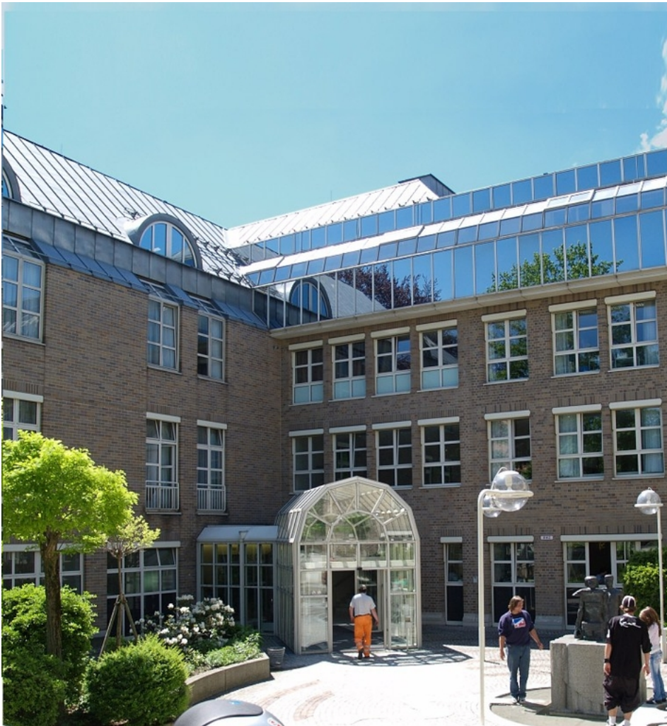
Abbildung: Die Schreiber Klinik zählt seit ihrer Gründung 1952 zu den angesehensten Privatkliniken Münchens. Als Familienbetrieb bietet sie Patienten aller Kassen ein gehobenes medizinisches Niveau, außergewöhnlichen Komfort und ein sehr persönliches Ambiente.