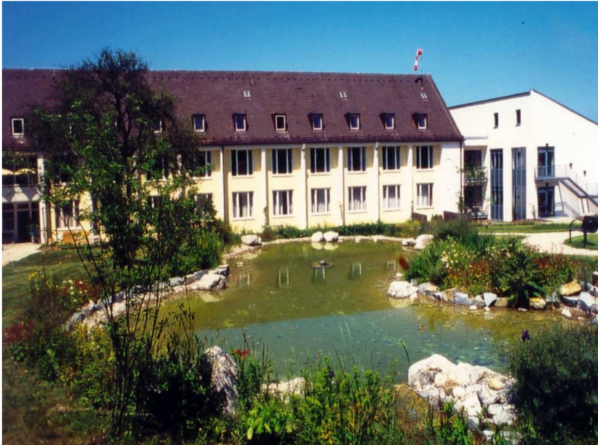
Abbildung: Das Bild zeigt eine Teilansicht der Klinik vom Park aus.

Die landschaftlich reizvoll gelegene Chirurgische Klinik Seefeld versorgt seit 1874 Patienten des Landkreises Starnberg sowie angrenzender Landkreise.