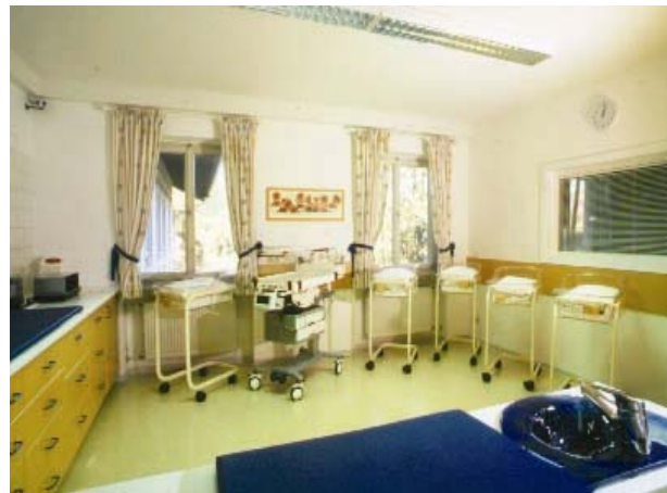
Abbildung: Kreißsaal und Kinderzimmer