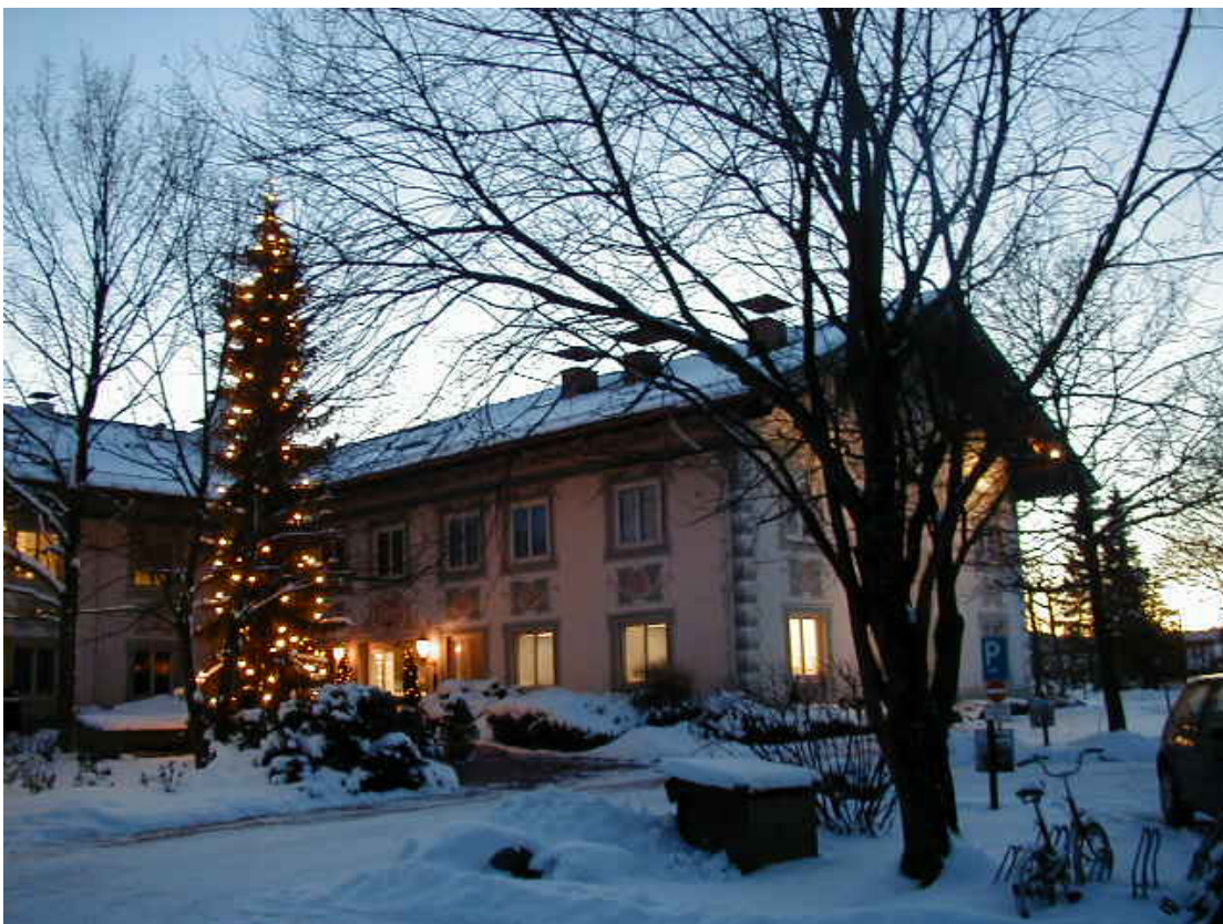
Abbildung: Frauenklinik Prien im Winter