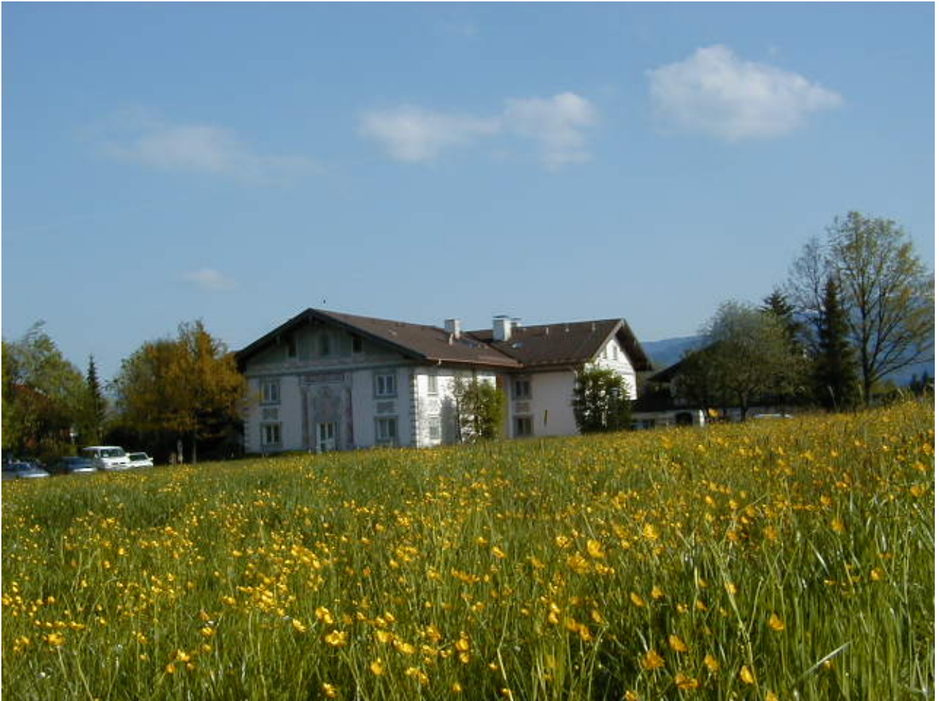
Abbildung: Frauenklinik Prien