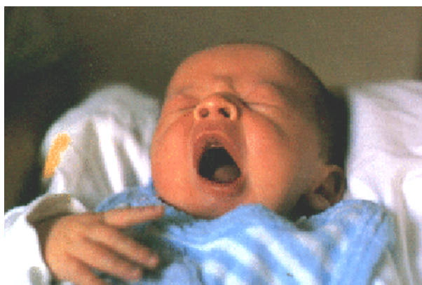
Abbildung: Frauenklinik Prien, Neugeborenes