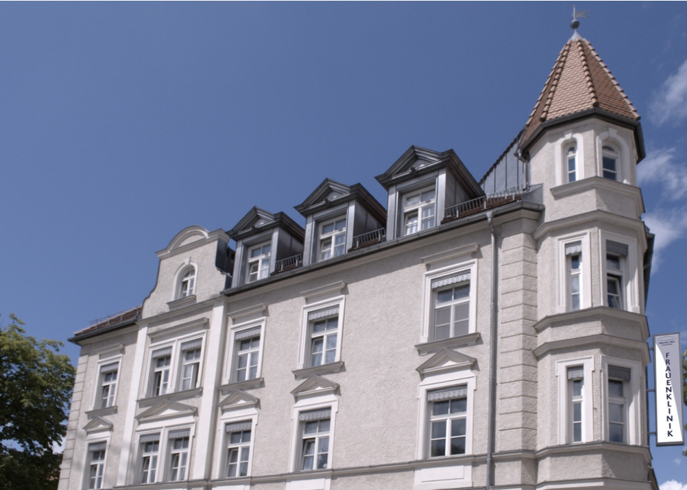
Abbildung: Frauenklinik München West - (ehemals Krüsmannklinik)