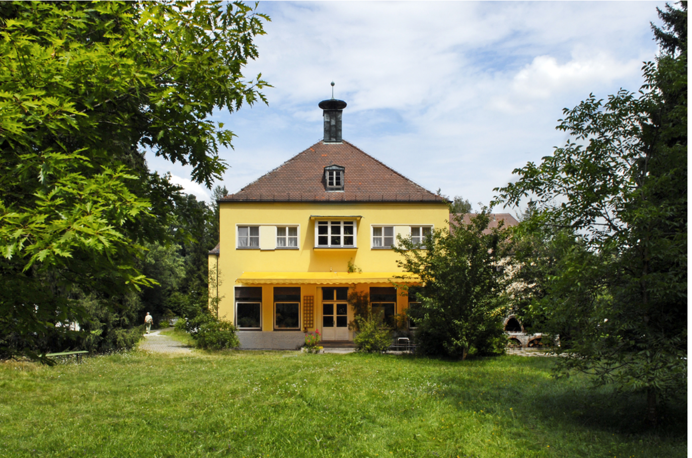
Abbildung: Gartenansicht der Klinik Mengerschwaige