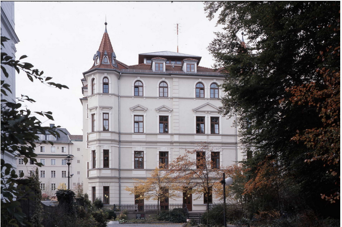
Abbildung: Ansicht der Augenklinik Herzog Carl Theodor