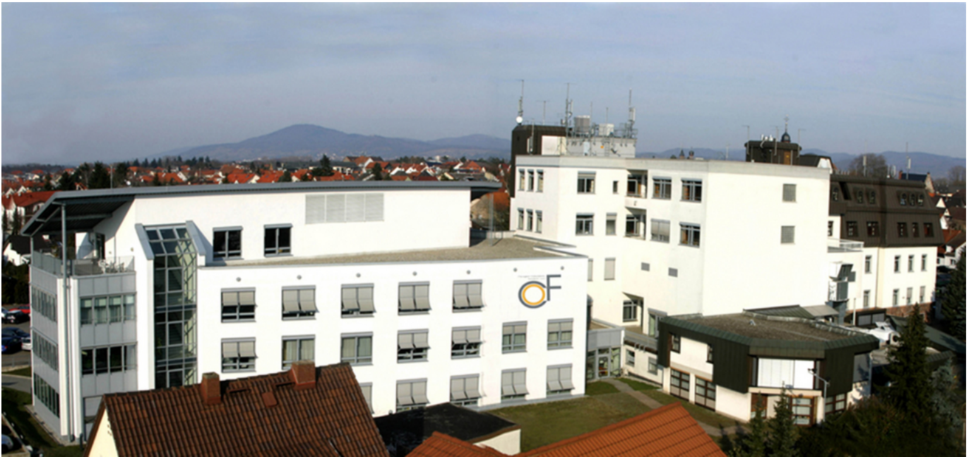
Abbildung: Die Chirurgisch-Orthopädische Fachklinik Lorsch GmbH & Co. KG

Sehr geehrte Leserin, sehr geehrter Leser,