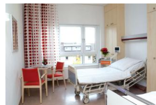
Beispiel für Patientenzimmer

Über die entstehenden Kosten - diese werden in der Regel von der privaten Krankenversicherung oder einer Zusatzversicherung übernommen - beraten Sie gerne Mitarbeiter bei der Aufnahme.