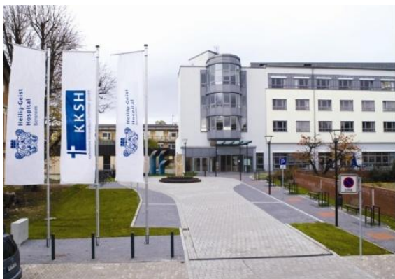
Außenansicht unseres Hauses