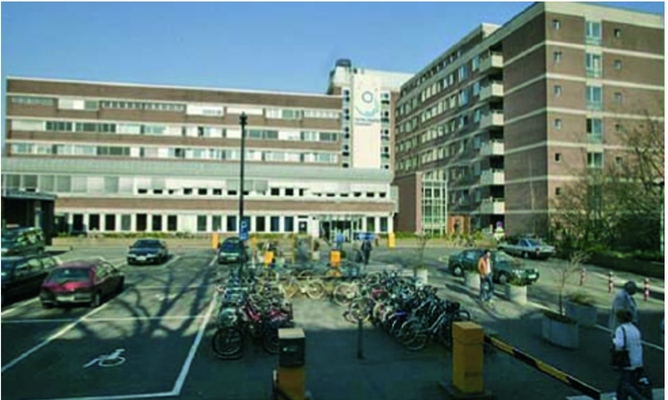
Abbildung: Marien Hospital Düsseldorf, 2008